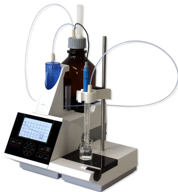
Titramax VT BROMINE

Das Ergebnis wird in mg Br 2 /100 g (Brom-Index) oder g Br 2 /100 g (Brom-Zahl) dargestellt.